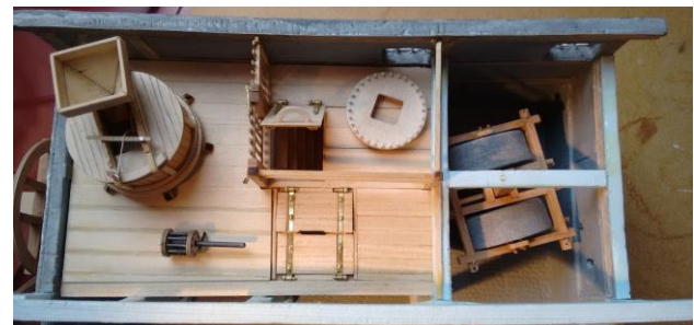
Interieur van Watermolen de Mast