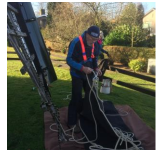
De voorbereidingen bij het plaatsen van de zeilen bij kijken.