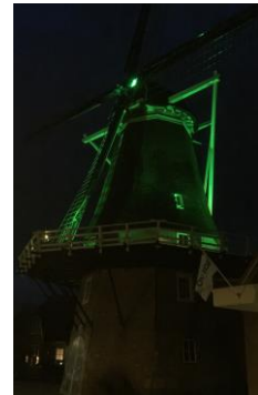
De Borgelinkmolen ook