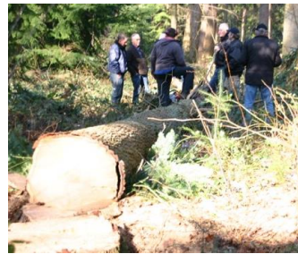
Van Boom .....

In samenwerking met de Stichting Edwina van Heek hebben de mannen van onze molenstichting een eik gekapt op het landgoed Singraven. Deze dode boom stond op de nominatie om gekapt te worden om zo ruimte te maken voor andere bomen. De boom is verslept naar en tot staart gezaagd in de zaagmolen van Singraven. De totale lengte van de staart bedraagt 12 meter. Het zagen van de staart is een arbeidsintensief proces, mede i.v.m. met beschikbare lengte van de zaagslede. Er kan over een lengte van 6 meter worden gezaagd. Daarna moet de boom worden opgekrikt, de zaagslede teruggehaald en boom weer worden teruggelegd en afgesteld. Dan pas kan de rest worden doorgezaagd. Al met al kost deze klus zo'n halve week met een paar man. Maar het eind resultaat mag er zijn. De nieuwe staart is goed gelukt en is hard nodig voor de renovatie van de Oortmanmolen. De oude staart is namelijk in zeer slechte staat en daarom hoognodig aan vervanging toe.