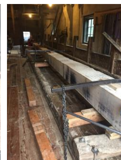
..... tot Staart.