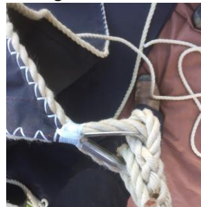
Mooie goed afgewerkte zeilen. Hier komt veel vakmanschap bij kijken.

De St. Nicolaasmolen is van nieuwe zeilen voorzien. Dat was hard nodig omdat de oude zeilen versleten waren door de inwerking van weer en wind. De nieuwe zeilen zijn met zeer veel passie en vakbekwaamheid zijn gemaakt door firma "De Koning Molenzeilen".