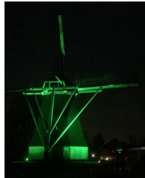
De St Nicolaasmolen kleurt groen

Eind februari kleurden de St. Nicolaasmolen en de Westerveldmolen groen. Deze ludieke actie is uitgevoerd tijdens het jubileumweekend van carnavalvereniging "J.V.C De Greune Köttelpeerkes". De Greunen vierden namelijk hun 4x11 (=44) jarig bestaan. Deze carnavalvereniging voor jongeren uit Denekamp en omstreken hebben onze molens in hun mooie groene verenigingskleur gezet.