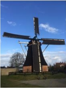
Vier stuks mooie nieuwe zeilen voor de St Nicolaasmolen