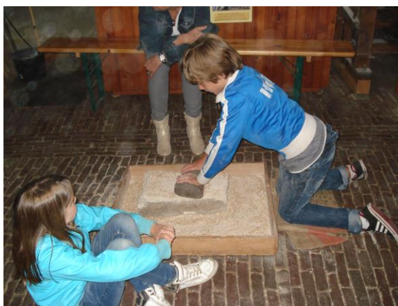
Voordat de molen was uitgevonden deed men het met de hand