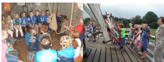
De molenaar vertelt met z'n allen op de stelling