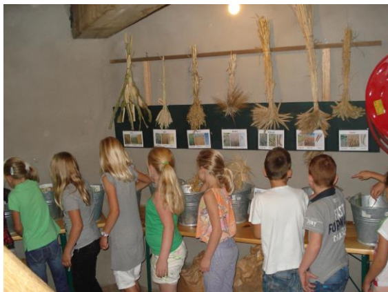
Wat is het verschil tussen rogge, tarwe, gerst en spelt?

de molenaars de tijd genomen om allerlei wetenswaardigheden te vertellen over de molen, zijn omgeving en het maalproces. Bij terugkeer op school gaan de kinderen aan de slag om een project te maken met als onderwerp de molen.