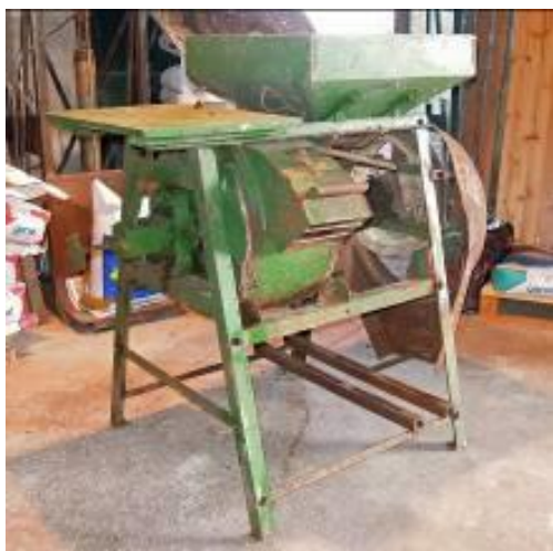
De maalstoel in ongerestaureerde toestand

Ootmarsum kwamen de nodige financiën beschikbaar.