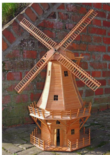
Sate molen, circa 75 cm hoog