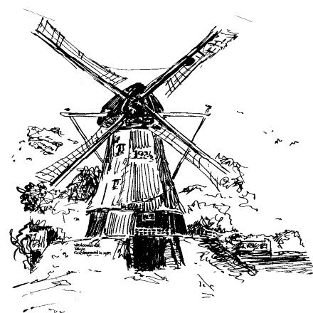
De Westerveldmolen te Tilligte.