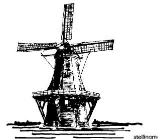
Oortmanmolen te Lattrop

De donateurs-actie werd gestart met een artikel in "Dinkelland Visie, waarin een mooie retour-ansichtkaart was ingesloten. Reeds zond een redelijk aantal lezers van het blad deze kaart met antwoordnummer retour. Daarmee werd ons tevens machtiging verleend voor een jaarlijkse afschrijving van het donateursbedrag van € 12,50. Alle nieuwe donateurs hebben inmiddels het bedankje in de vorm van een geschenkpakket ontvangen. Wij danken hen hartelijk voor hun reactie op onze oproep.