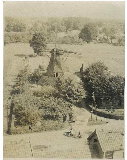
De Nicolaasmolen anno 1937

In de Borgelinkmolen kunt U presentaties bewonderen en de Westerveldmolen biedt poffertjes.