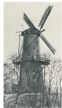
De Meiboom 1745

De aanvoer van vee heeft thans met vrachtauto's plaats. De veemarkt werd verplaatst naar de Croeselaan, evenals de groente- en vruchtenveiling. Wat we nu als onnodig zien, was destijds urgent. Maar de stad heeft er een onherstelbaar verlies door geleden. Moge dit een waarschuwing zijn voor heden en toekomst.