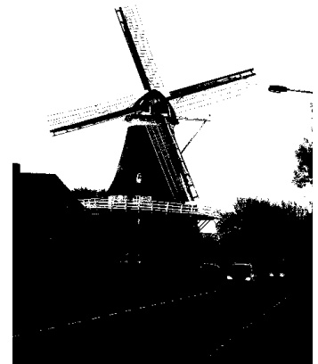
Borgelinkmolen in rouwstand

Wij zullen haar in dankbaarheid blijven gedenken.