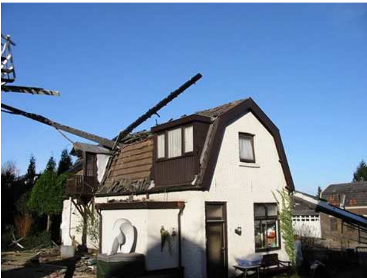
Een goede opleiding ter voorkoming van ongelukken is nodig.

Deze vrijwilligers zijn in oktober 2000 met de cursus begonnen. De cursus omvat 20 theorieavonden, 1x per maand een avond, waarbij de gehele molen van onder tot boven en van binnen en buiten wordt besproken. Het gaat in dit geval niet alleen om de korenmolen, maar ook andere molens worden op de diverse avonden doorgenomen zoals poldermolens ( binnen – en buitenkruiers ), diverse industriemolens, de paltrok en de houtzaagmolen, standermolen, wipmolen en watermolens. Door middel van dia's en tekeningen kan men zien hoe de molen in elkaar steekt en krijgt men uitleg over het staande en gaande werk. Ook het