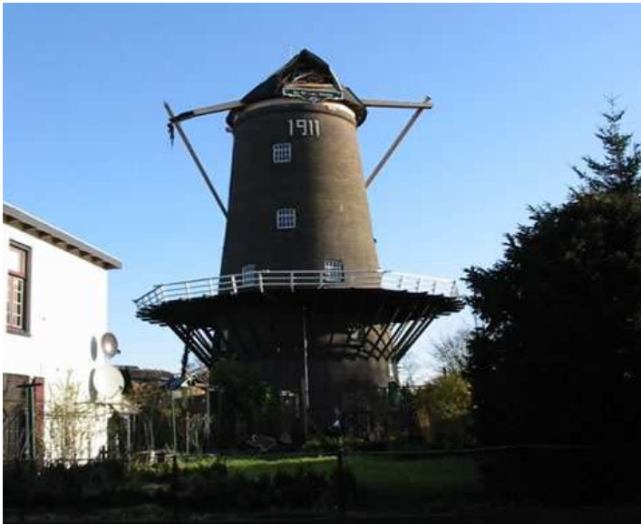
Tijdens een plotselinge hoosbui, die gepaard ging met krachtige valwinden is op zaterdag 9 maart het wiekenkruis van De Nieuwe Molen te Veenendaal gevallen

Deze vrijwilligers zijn in oktober 2000 met de cursus begonnen. De cursus omvat 20 theorieavonden, 1x per maand een avond, waarbij de gehele molen van onder tot boven en van binnen en buiten wordt besproken. Het gaat in dit geval niet alleen om de korenmolen, maar ook andere molens worden op de diverse avonden doorgenomen zoals poldermolens ( binnen – en buitenkruiers ), diverse industriemolens, de paltrok en de houtzaagmolen, standermolen, wipmolen en watermolens. Door middel van dia's en tekeningen kan men zien hoe de molen in elkaar steekt en krijgt men uitleg over het staande en gaande werk. Ook het